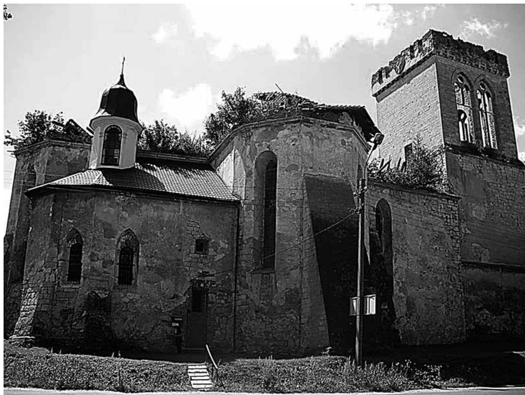
Il. 43. Podhajce. Kościół pw. św. Trójcy

W kaplicy Potockich przy kościele pochowany jest Stanisław „Rewera” Potocki. Kaplica ta jest obecnie wyremontowana i przystosowana do obrządku liturgicznego. Odprawiane są tam msze niedzielne przez proboszcza z Brzeżan dla ok. 50 miejscowych katolików. Reszta kościoła znajduje się w fatalnym stanie technicznym: dach jest zawalony, a wewnątrz zdewastowane. O sytuacji kościoła alarmowały także polskie media na Ukrainie 15 .