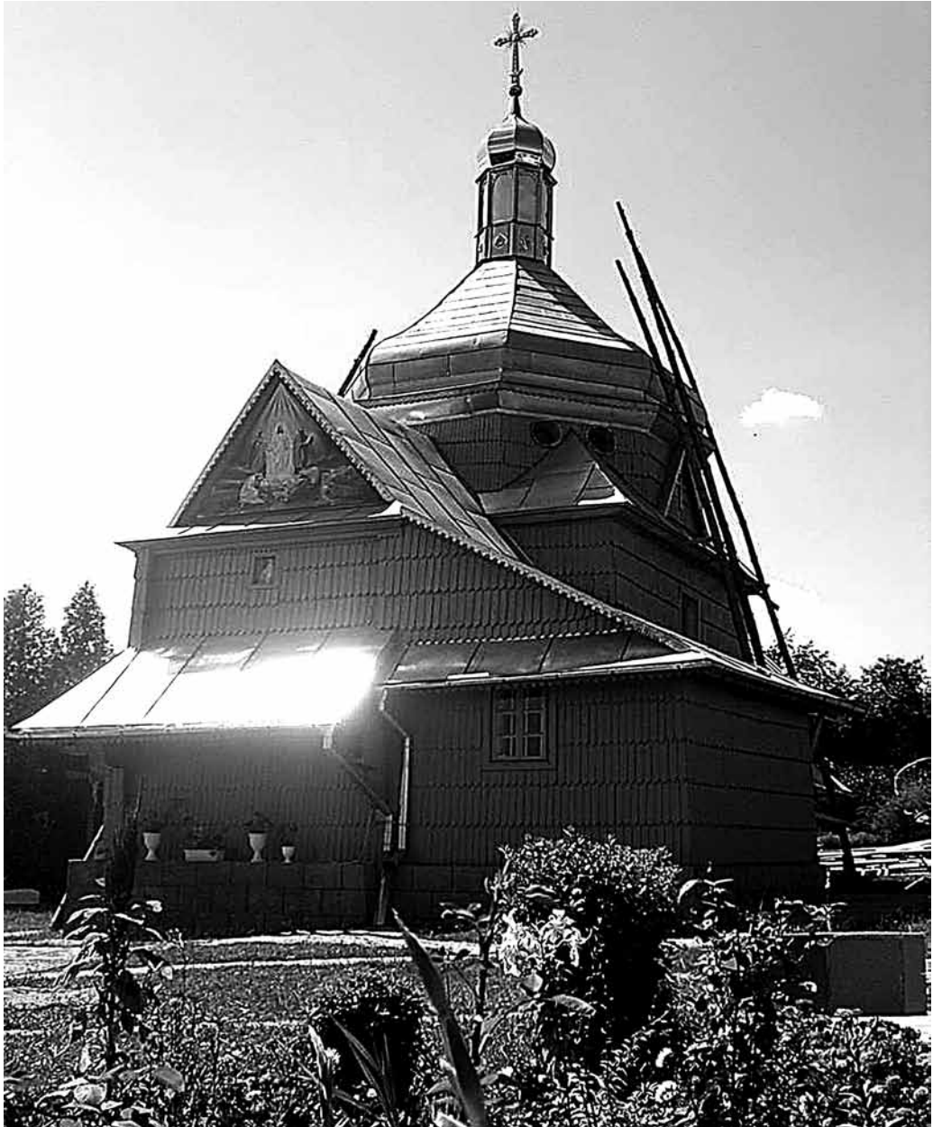
Il. 44. Podhajce. Cerkiew pw. Przemienienia Pańskiego

okien – na błękitno. Położona jest bardzo malowniczo na wzgórzu, na którego zboczu ulokowany jest cmentarz 16 . W porównaniu z kościołem rzymskokatolickim, cerkwią prawosławną i synagoga, cerkiew pw. Przemienienia Pańskiego jest najbardziej oddalona od rynku i centrum miasta.