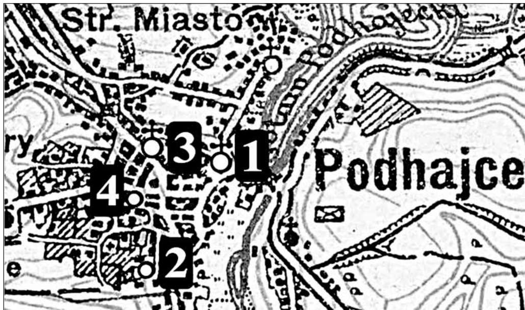
Mapa 16. Podhajce na mapie WIG z oznaczeniem obiektów sakralnych: 1. kościół parafialny; 2. cerkiew pw. Przemienienia Pańskiego; 3. cerkiew pw. Zaśnięcia Bogarodzicy; 4. synagoga

W czasie II wojny światowej Podhajce – podobnie jak inne miasteczka zachodniej Ukrainy – były świadkiem krwawych mordów. Od 1942 r. na terenie Podhajec Niemcy utworzyli getto, do którego zwieziono Żydów z terenu całego dawnego powiatu podhajeckiego. Mieściło się w okolicach synagogi, między ul. Szeroką, Brzeżańską i Rynkiem. Eksterminację ok. 2000 Żydów przeprowadzono w dwóch turach: w pierwszej połowie 1943 r. oraz latem 1943 r. Ofiary zostały rozstrzelane i zakopane w masowych gro-