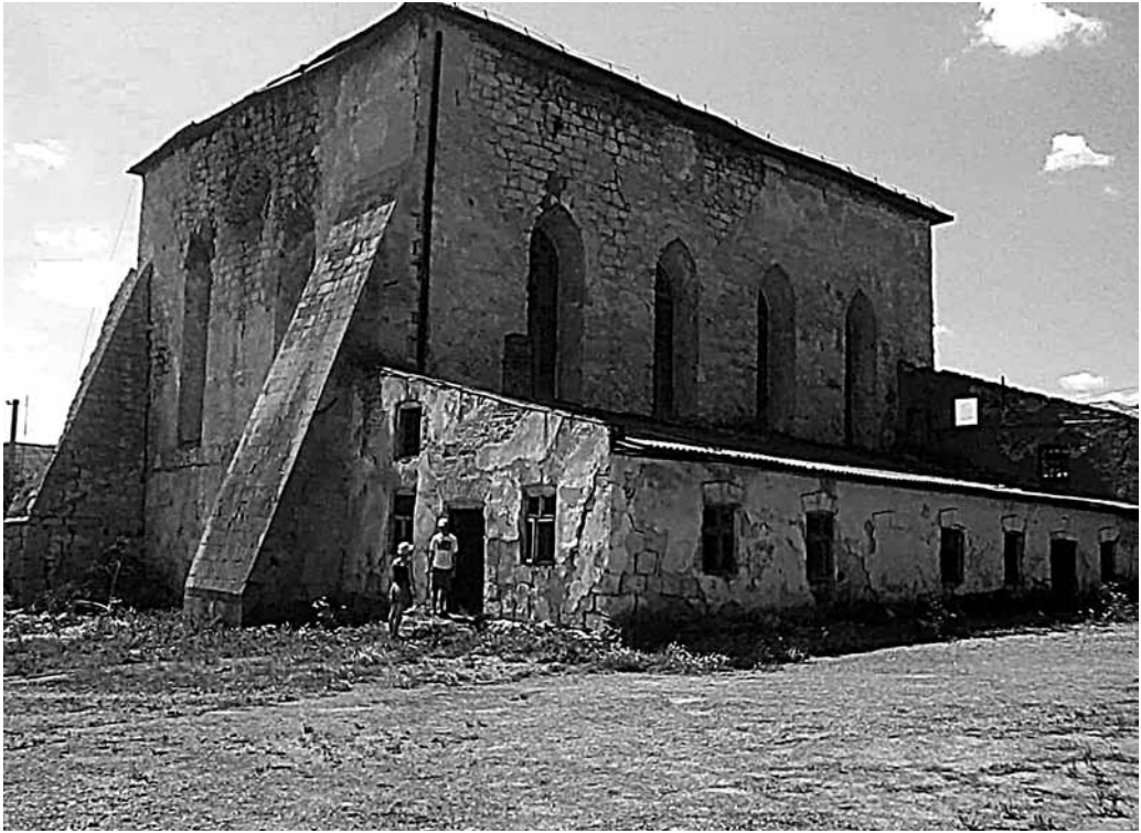
Il. 46. Podhajce. Synagoga

go lub drewnianego pomieszczenia o prostym kształcie prostopadłościanu, o dachu półkolistym lub dwuspadowym. Zwykle posiada także drzwi, a czasem okienka. Wznosi się ohele nad grobami wybitnych rabinów czy cadyków (Z. Borzymińska, R. Żebrowski, Polski słownik judaistyczny. Dzieje, kultura, religia, ludzie , 2, Warszawa 2003, s. 256).