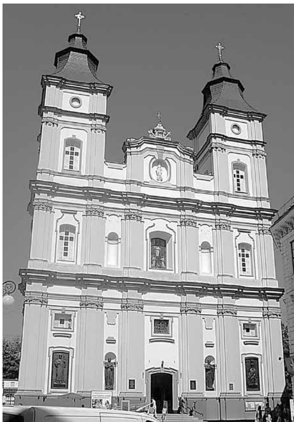
Il. 60. Stanisławów. Dawny kościół Jezuitów (obecnie katedra greckokatolicka)

Naprzeciwko kolegiaty, po drugiej stronie placu, widnieje sylwetka dawnego kościoła Jezuitów. Budowla jest zwrócona bokiem do placu, a fasada wychodzi na ulicę prowadzącą do rynku głównego. Jezuita przybyli do miasta w 1715 r. i po niespełna 15 latach, w 1729 r., wprowadzili się do nowo wybudowanego klasztoru 10 . Jednonawowa świątynia, otoczona wieńcem kaplic, z dwukondygnacyjną fasadą flankowaną wieżami, jest typowym założeniem jezuickim, dopełnionym jeszcze kolegium ukończonym w 1744 r. Przylega ono do prawej nawy bocznej. Po jego wybudowaniu zakonnicy szybko przejęli sprawy szkolnictwa w mieście, wraz ze wspomnianą Akademią. Jezuita działali w Stanisławowie do kasaty zakonu w 1773 r. W 1847 r. ich dawną świątynię adaptowano na parafię unicką. Od 1850 r., a formalnie od 1885 r., kościół pełni funkcję katedry biskupstwa unickiego. Oryginalne barokowe wyposażenie nie zachowało się do naszych czasów, a polichromie oraz ikonostas pochodzą z XIX i częściowo z XX stulecia. Jezuita powrócili do Stanisławowa w 1883 r. i początkowo korzystali gościnnie ze świątyni ormiańskiej. Pod koniec XIX w. wybudowali niewielki neobarokowy kościółek na północnych przedmieściach miasta, przy ul. Zabłotowskiej, gdzie obecnie znajduje się cerkiew prawosławna 11 .