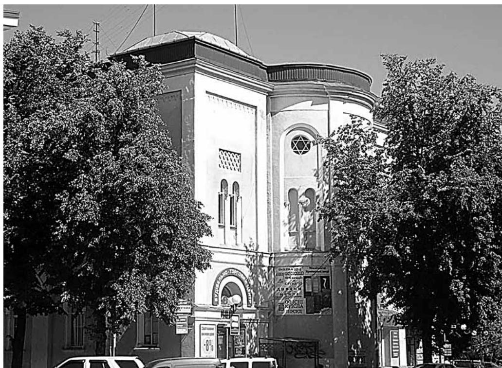
Il. 62. Stanisławów. Synagoga Postępowa

byli gorzej traktowani przez władze miejskie oraz właścicieli. W XVIII stuleciu, pod rządami tolerancyjnych Józefa i Stanisława Potockich, Żydzi stopniowo poprawiali swoją pozycję i w coraz większej mierze wchodzili już nie tylko w kręgi handlowe, lecz także rzemieślnicze. Rozwijającej się społeczności nie wystarczała stara drewniana synagoga i ostatecznie w 1777 r. doszło do wymurowania nowej bóżnicy, znajdującej się w centrum dzielnicy żydowskiej. W drugiej połowie XIX w. uznanie wśród społeczności żydowskiej zyskały ruchy reformatorskie. W latach siedemdziesiątych powstało w mieście Towarzystwo Postępowe, przekształcone później w Towarzystwo Świątyni Izraelskiej, które doprowadziło do wybudowania Synagogi Postępowej pod koniec lat dziewięćdziesiątych. Warto podkreślić, że usytuowana na południowy wschód od rynku budowla również obecnie pełni funkcje kultowe, co jest sytuacją wyjątkową na zachodniej Ukrainie. Charakterystyczny budynek w stylu renesansowo-mauretańskim 20 przetrwał obie wojny, choć utracił atrakcyjne narożne wieżyczki 21 .