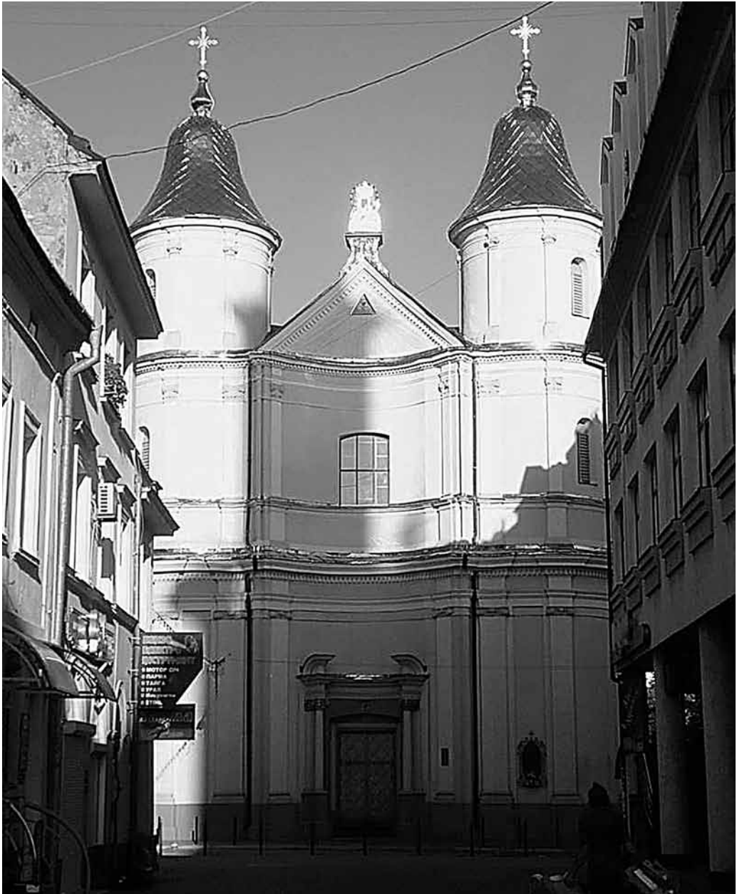
Il. 61. Stanisławów. Dawny kościół ormiański (obecnie katedra prawosławna)

Historia Stanisławowa, podobnie jak wszystkich innych kresowych miast i miasteczek, jest nierozdzielnie związana ze społecznością żydowską, która zamieszkiwała początkowo północną dzielnicę miasta 19 . Tam wniesiono pierwszą drewnianą synagogę, jednak w związku z rozbudową zamku na północnych rubieżach miasta Andrzej Potocki postanowił przenieść Żydów na południe od rynku. Dzięki korzystnemu przywilejowi mogli oni konkurować ekonomicznie z Polakami oraz Ormianami, chociaż okresowo