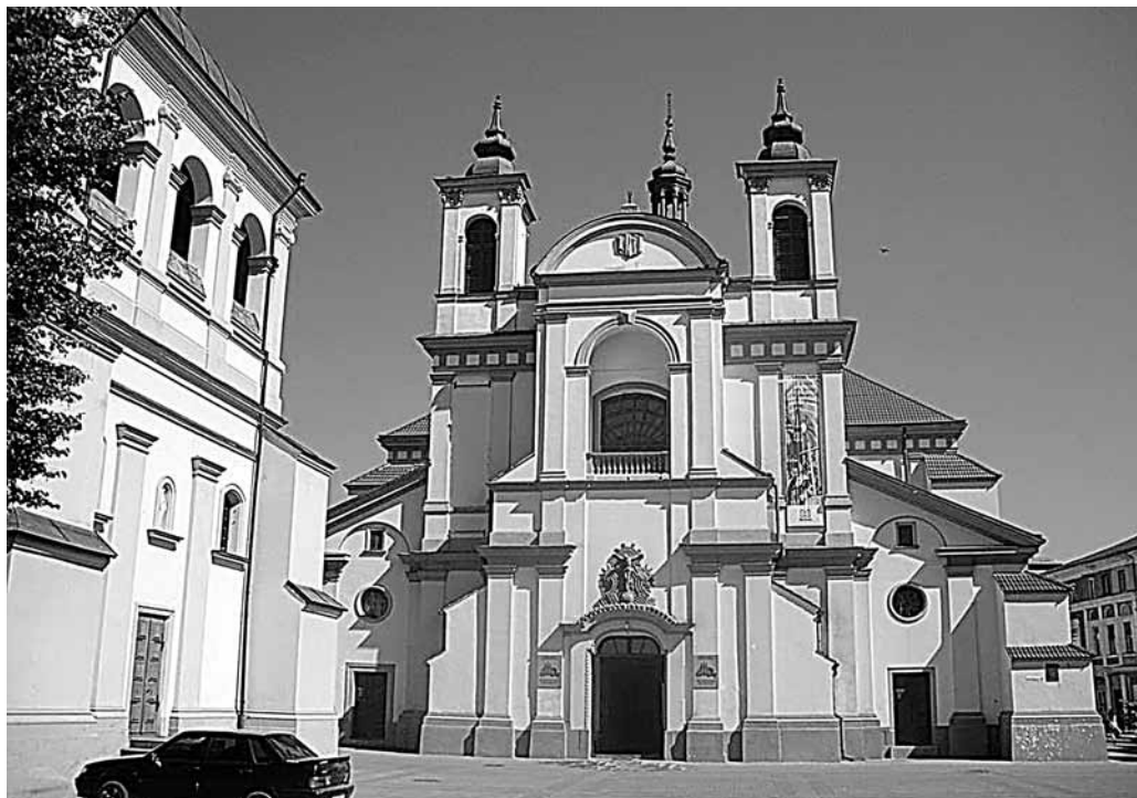
Il. 59. Stanisławów. Kolegiata

Idąc z rynku w stronę zachodnią, dochodzi się do podłużnego placu, będącego dawniej centrum polskiej – katolickiej dzielnicy. Całą północną pierzeję zajmuje najstarsza