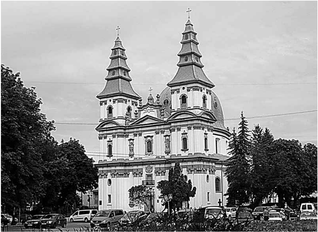
Il. 63. Tarnopol. Dawny kościół dominikański pw. św. Wincentego Ferreriusza (obecnie sobór katedralny pw. Niepokalanego Poczęcia NMP)

z inicjatywy ówczesnego właściciela miasta – hetmana wielkiego koronnego Józefa Potockiego. Dominikanie otrzymali tereny w północno-wschodniej części miasta, przy wałach miejskich 13 . Kościół został wzniesiony jako trójnawowa bazylika na planie owalu, z dwiema wieżami i prostokątnym prezbiterium. Od momentu powstania budynek fasadą zwrócony był w kierunku placu (obecnie Majdan Woli). Konsekracja kościoła nastąpiła 15 I 1780 r. Już w 1784 r. przeniesiono do niego parafię tarnopolską. Od tego czasu kościół służył jednocześnie dominikanom i duchowieństwu świeckiemu. Kiedy w 1820 r. nastąpiło wydalenie dominikanów z Tarnopola (przeniesienie konwentu do Żółkwi), budynki poddominikańskie, tj. kościół i klasztor, zostały przekazane przybyłym właśnie z Białorusi jezuitom, którzy mieli prowadzić w mieście szkołę. Przez wszystkie lata swojego pobytu w XIX w. w Tarnopolu jezuita dzielili zarząd kościołem poddominikańskim z miejscową parafią tarnopolską. W 1901 r. jezuita opuścili klasztor poddominikański, a w dwa lata później do Tarnopola powrócili dominikanie, którzy zajęli swoje dawne budynki klasztorne wraz z kościołem pw. św. Wincentego 14 . Po powrocie dominikanów do Tarnopola przez kilka pierwszych lat (do 1908 r.) siedzibę w kościele mendykanckim współdzieliła z nimi parafia tarnopolska. W 1939 r. klasztor i kościół zostały spalone i zrabowane przez wojska sowieckie, a dominikanie ponownie opuścili Tarnopol, do