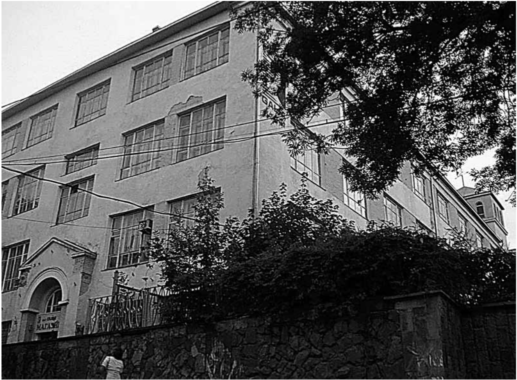
Il. 64. Tarnopol. Dawny kościół jezuicki

którego powrócili na krótko w 1942 r. (po wkroczeniu Niemców). Po wojnie kościół odremontowano i wykorzystywano jako galerię obrazów. Obecnie służy on jako greckokatolicki sobór katedralny pw. Niepokalanego Poczęcia NMP. W budynku klasztornym mieści się archiwum obwodowe.