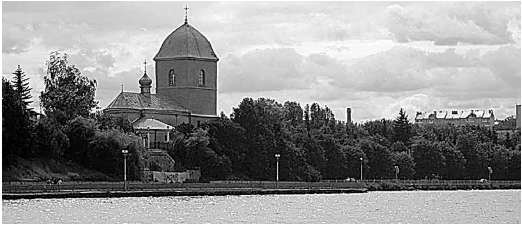
Il. 65. Tarnopol. Cerkiew pw. Podwyższenia Krzyża Świętego

siona w końcu XVI w. 23 na zachód od rynku, nad stawem niedaleko Seretu, przy ul. Ruskiej. Masywna wieża frontowa ukończona została w 1627 r. Korpus wzniesiono na planie prostokąta, z półkolistą zamkniętą częścią prezbiterialną. Do końca II wojny światowej cerkiew należała do duchowieństwa greckokatolickiego. W toku działań wojennych cerkiew znacznie ucierpiała, po czym przez kilkanaście lat nie pełniła funkcji sakralnych. Obecnie świątynia należy do Ukraińskiego Autokefalicznego Kościoła Prawosławnego.