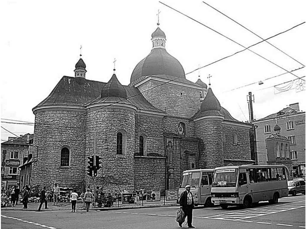
Il. 66. Tarnopol. Cerkiew parafialna pw. Narodzenia Chrystusa

siona w końcu XVI w. 23 na zachód od rynku, nad stawem niedaleko Seretu, przy ul. Ruskiej. Masywna wieża frontowa ukończona została w 1627 r. Korpus wzniesiono na planie prostokąta, z półkolistą zamkniętą częścią prezbiterialną. Do końca II wojny światowej cerkiew należała do duchowieństwa greckokatolickiego. W toku działań wojennych cerkiew znacznie ucierpiała, po czym przez kilkanaście lat nie pełniła funkcji sakralnych. Obecnie świątynia należy do Ukraińskiego Autokefalicznego Kościoła Prawosławnego.