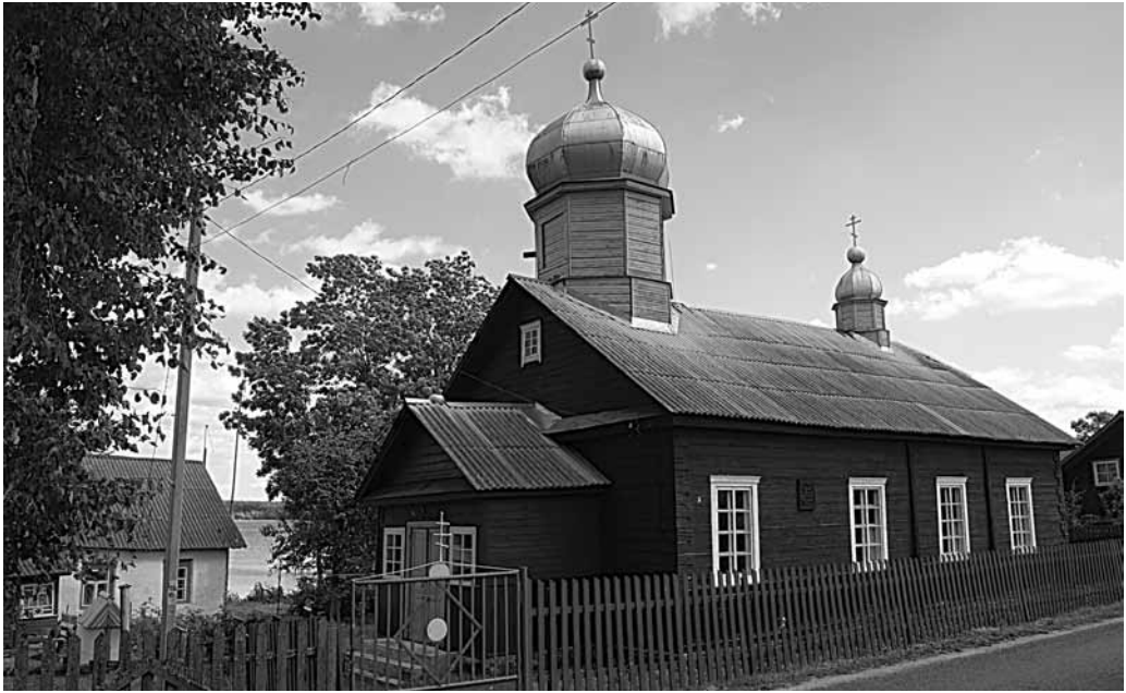
Il. 125. Świr. Molenna

Do dziś zachowała się także drewniana molenna staroobrzędowców pw. Zaśnięcia Bogarodzicy . Wybudowano ją w 1906 r. na skraju miasteczka 12 , nad brzegiem jeziora. Oprócz tego w Świrze funkcjonuje drewniana cerkiew prawosławna pw. św. św. Cyryla i Metodego z 1990 r. 13 , położona przy drodze prowadzącej do miasteczka od północy.