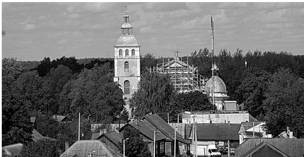
Il. 124. Świr. Kościół parafialny pw. św. Mikołaja

Krajobraz sakralny miejscowości jest zdominowany przez kościół pw. św. Mikołaja , znajdujący się przy głównej ulicy w centrum. Został ufundowany w 1452 r. przez księcia Jana Świrskiego. Początkowo był budowlą drewnianą 6 . W latach 1570–1598 został opuszczony przez katolików i funkcjonował prawdopodobnie jako zbór, bowiem wtedy Świrscy przeszli na kalwinizm 7 . Kościół wrócił do wspólnoty katolickiej, co mogło być związane ze sprzedażem Świru Radziwiłłom. W 1653 r. świątynia została wymurowana staraniem chorążego oszmiańskiego Fabiana Koziełły 8 . Niektóre publikacje uznają tę datę za rok fundacji kościoła 9 . Obecny wygląd budowli jest efektem prawie całkowitej przebudowy z lat 1908–1909. Wtedy znacząco powiększono świątynię i nadano jej charakter neobarokowy 10 . Kościół funkcjonował do 1962 r., kiedy to został przerobiony na montownię traktorów. Zwrócono go wiernym w 1990 r. 11