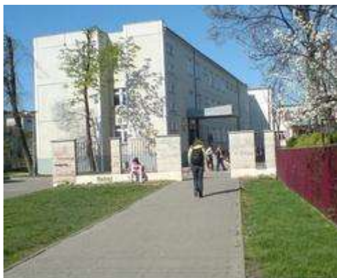
Fotografia 1. Budynek szkoły