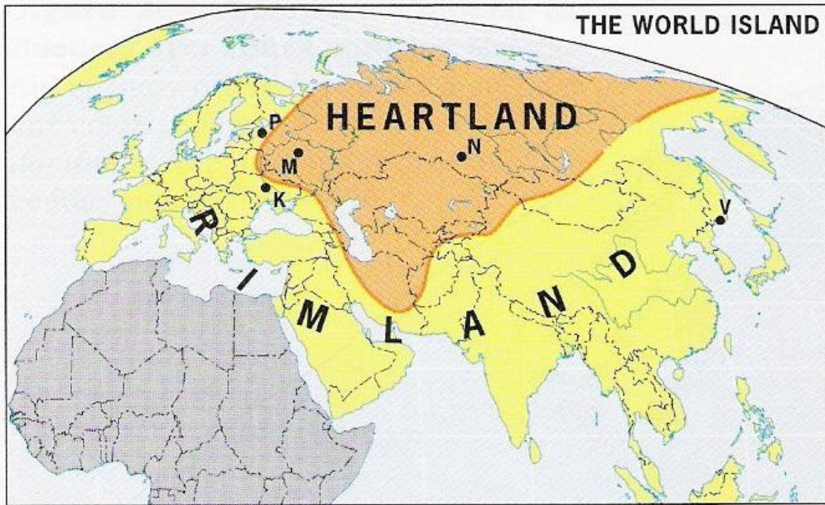
Mapa 1. Przybliżone umiejscowienie Heartlandu i Rimlandu