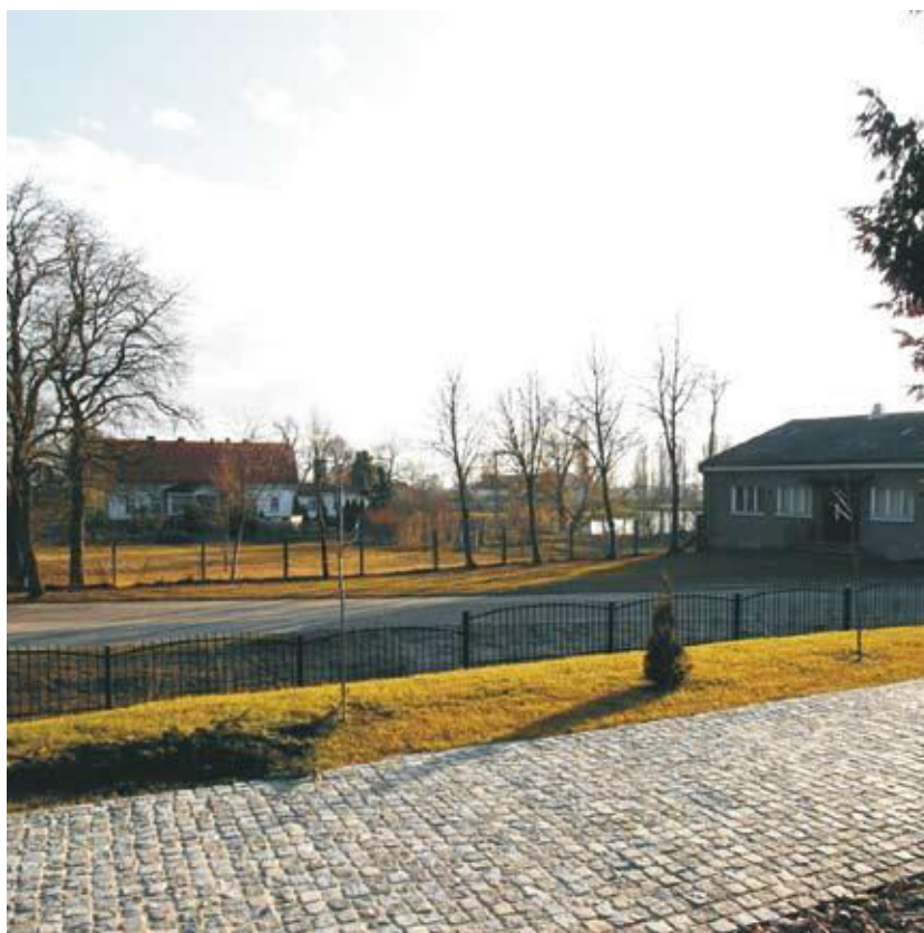
Fot. 2. Widok na przestrzeń między dworem, świetlicą (dawną oberżą) a kościołem, 2015.

Przedstawione dotąd obiekty są personifikacją trzech dawnych stanów wpisanych w tradycję polską: szlachty/ziemiaństwa (dwór), chłopstwa (karczma) i duchowieństwa (kościół). To właśnie tutaj przebiegała granica między wsią chłopską (z kościołem na czele) a wsią pańską (z zespołem dworsko-folwarcznym). Wnętrze to stanowiło łącznik społeczny dwóch różnych światów. Niegdyś pełne gwaru rozprawiających ze sobą stanów ucichło. Jeszcze do niedawna przy kościele znajdowały się metalowe sztaby. Uznane za zbyt ciężkie zostały usunięte. Nie znając tożsamości miejsca, pozbyto się elementów, które bynajmniej nie znalazły się tutaj przypadkiem. To właśnie do nich przywiązywano konie podążających na mszę świętą parafian lub do oberży biesiadników. W parku dworskim zaniechano pielęgnacji drzewostanu, zaś przy kościele dochodzi do świadomych i błędnych decyzji przy kształtowaniu zieleni. Oś kompozycyjna łącząca kościół i dwór ulega więc zatarciu. Oba obiekty posiadają niezaprzeczalnie wartości zabytkowe. Pozbawiona przy tym nie tyle detalu, co całej formy świetlica powinna zostać poddana odnowie. Kluczem jest dbałość nie tylko o pojedyncze obiekty, ale jak wykazano o całą, jakże bogatą treść między nimi. Bez świadomości historii tego miejsca, przez błędne decyzje planistyczne może dojść do kolejnych, niekiedy niemożliwych do odwrócenia naruszeń tożsamości miejsca.