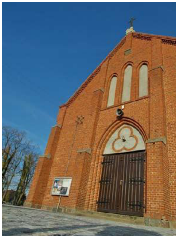
Fot. 1. Neogotycka fasada kościoła pw. św. Jana Chrzciciela w Murzynowie Kościelnym, 2015.