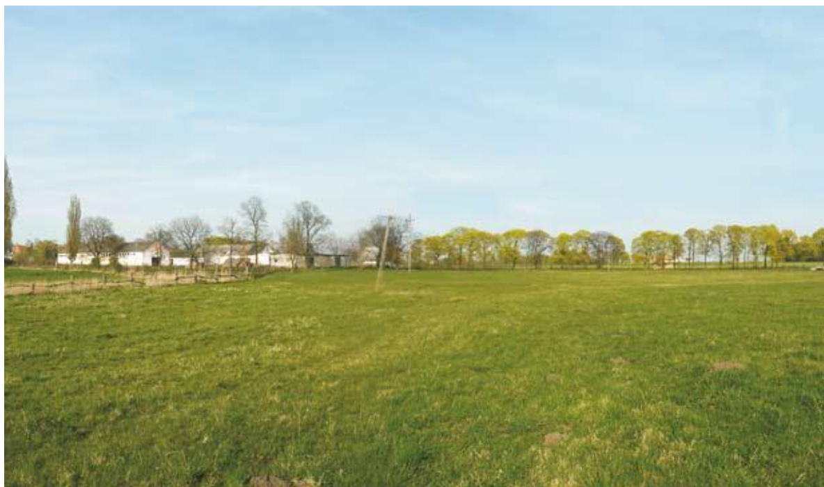
Fot. 4. Zespół dworsko-folwarczny w Murzynowie Kościelnym oraz „wybiegająca” z niego aleja klonowa, 2014.

Kierując się na południe, opuszczamy stopniowo wieś. Kierunek ten nie jest przypadkowy. Historia oddalonego o dwa kilometry Sabaszczewa jest istotnie połączona z losami Murzynowa Kościelnego. Siła tych powiązań zauważalna jest na tle dziejów w przestrzeni życia społecznego, w tym: administracji, szkolnictwie, religii i dawnej własności ziemskiej. Wraz z przestrzenią mentalną (duch, skojarzenia etc.) wywarła niesamowity wpływ na przestrzeń fizyczną, czyli naturę.