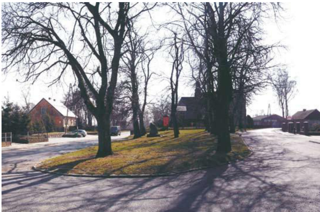
Fot. 3. Współczesny obraz zadrzewionego nawsia, w tle bryła kościoła, 2014.

Układ owalnicowy odznacza się charakterystycznym układem drogowym. Poza traktami obiegającymi nawsie typowym są rozwidlenia dróg na obu jego końcach. W przypadku Murzynowa charakterystyczne