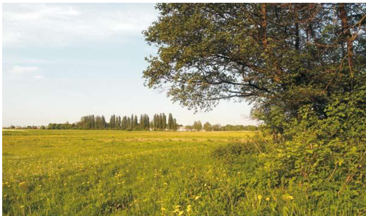
Fot. 5. Ujęcie krajobrazowe Murzynowa Kościelnego, w tle szpaler topoli włoskich i zabudowania folwarczne. Widok ze skraju Świątyni Dumania, 2014.

Przywołana wcześniej narracja krajobrazu znalazła swój najpełniejszy wymiar w obszarze doliny rzeki Bardzianki. Jej odcinek mieszczący się między Murzynowem a Sabaszczewem posiada wiele znaczeń. Wyeksponowany centralnie pośród łąk zagajnik jesionowy jest tego najlepszym potwierdzeniem. Potocznie zwany Świątynią Dumania 15 był miejscem spotkań dziedziców Ozdowskich i Jachimowiczów. To rodzaj zwornika krajobrazowego, tj. miejsca, z którego wybiegają osie widokowe w kierunku zespołów dworsko-folwarcznych sąsiednich wsi. Nad obydwoma górują dominanty w postaci 80-letnich szpalerów topoli włoskich 16 , wyrażających nie tyle panowanie właścicieli nad swymi ziemiami, co symbol więzi rodzinnych 17 .