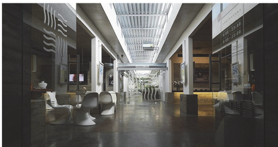
Rys. 3. Hotel HOT_elarnia [hotelarnia.pl]