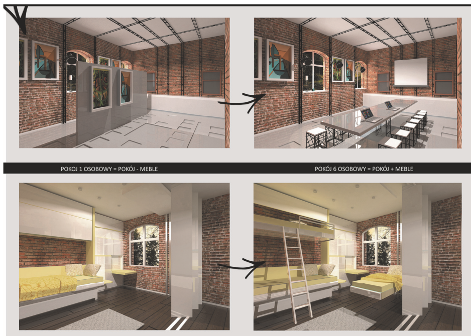
Rys. 6. Projekt hotelu w dawnym dworcu PKP [opracowanie K. Gajewska i A. Olesiak]

Projekt II powstał w dawnym dworcu PKP w miejscowości Lubawa, który obecnie jest nieczynny i pełni funkcję mieszkalną. Dzięki użyciu materiałów nawiązujących do pomniemieckiej stacji PKP, jakimi są stal i czerwona cegła, budynek zachował swój dawny charakter. Zyskał również nowoczesne wnętrza. Po analizie elementów wzorniczych i meblarskich stosowanych w przedziałach pociągów w hotelu zostały zaprojektowane składane i chowane meble mające wiele różnych zastosowań, dzięki czemu tak niewielka przestrzeń mogła spełniać wiele funkcji. Restauracja po schowaniu krzeseł w podłodze staje się przestrzenią wystawienniczą, która w kilka sekund może przemienić się w salę konferencyjną. Analogiczna sytuacja ma miejsce w pokojach hotelowych, które przekształcić można z pokoju jednoosobowego na wieloosobowy (rys. 6).