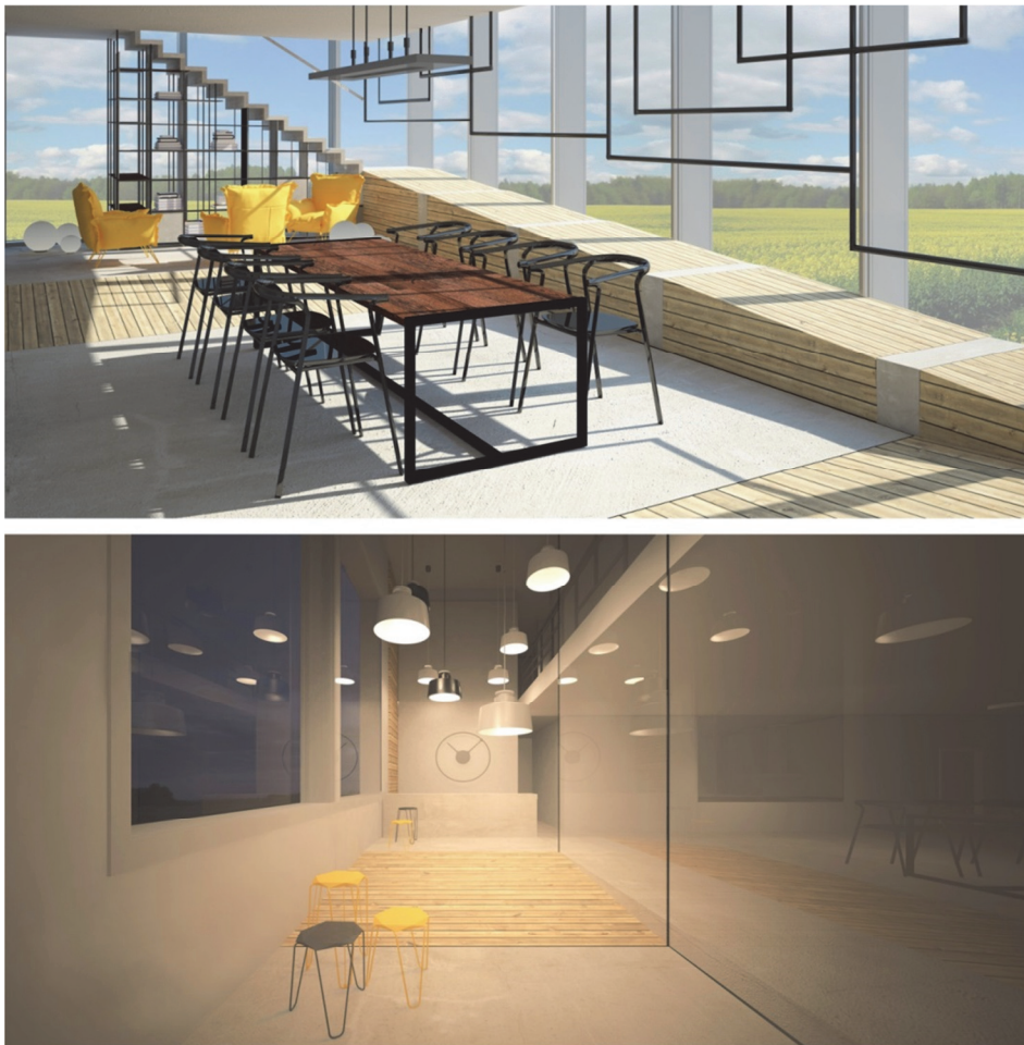
Rys. 7. Projekt hotelu w Chrystkowie [opracowanie M. Wiewiór i M. Płończak]

Aktywny, kreatywny i emocjonalny udział studentów w przeprowadzonym ćwiczeniu był dla autorki kolejnym argumentem przemawiającym za żywotnością roli tożsamości miejsca w projektowaniu wnętrz. Dla młodych adeptów architektury wnętrz było to istotne doświadczenie, którego idea będzie towarzyszyła ich przyszłym dokonaniom twórczym.