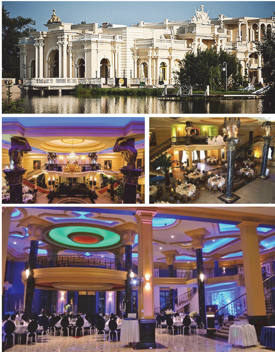
Rys. 4. Hotel Venecia Palace