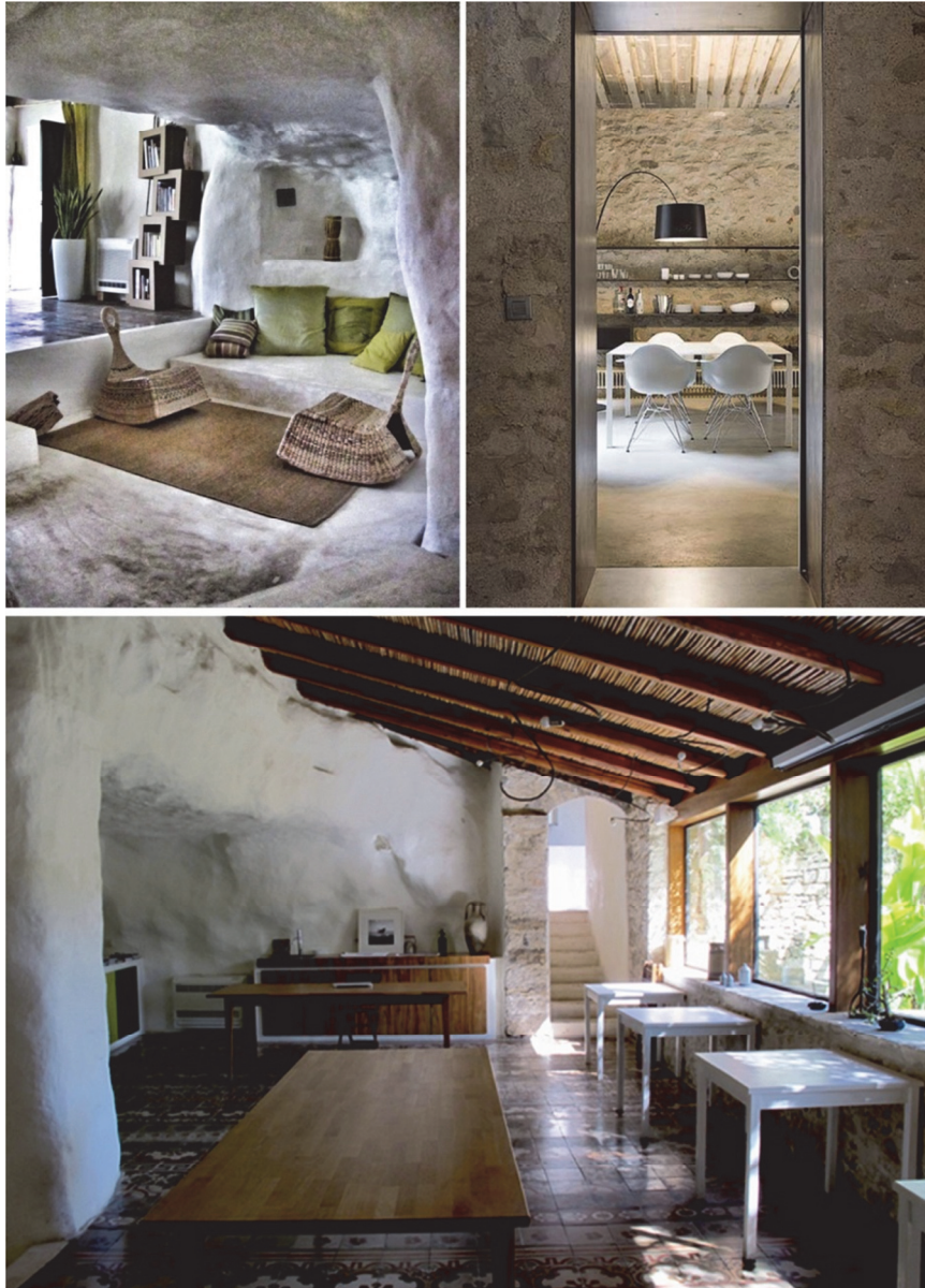
Rys. 2. Hotel Casa Talia

techniki wykonania wnętrza przestrzenie są nowoczesne i wyposażone w elementy, których oczekuje dzisiejszy klient hotelowy, jak m.in. automatyka budynku, klimatyzacja, Wi-Fi, wszelkie potrzebne sprzęty rtv i agd. Architekci, zachowując pozorną prostotę, wykreowali wnętrza stylowe, wygodne i pomysłowe. Każdy zakątek Casa Talia przypomina na różne sposoby wspaniałą przeszłość kulturalną wyspy, w tym okresy greckiej, arabskiej i hiszpańskiej dominacji.