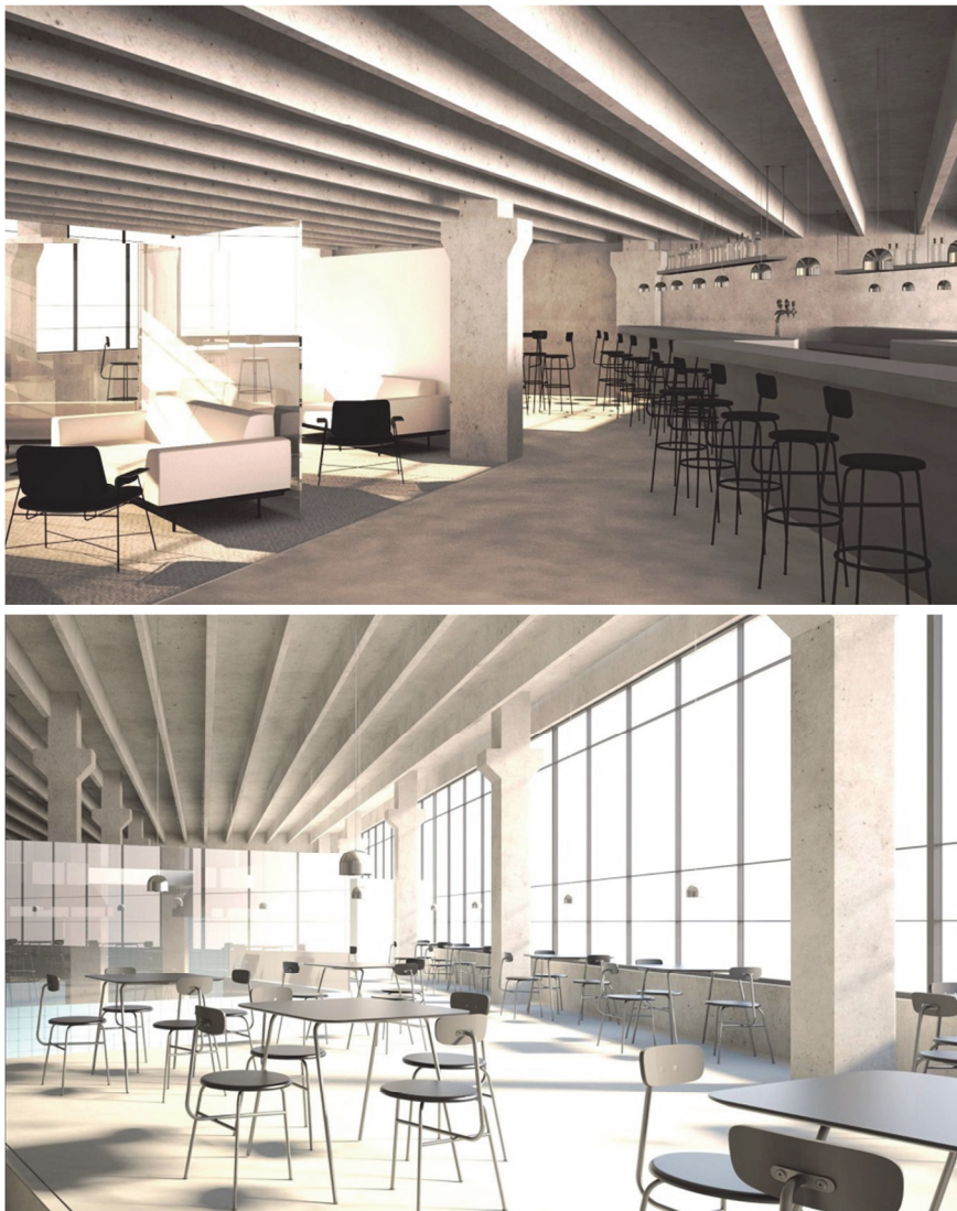
Rys. 5. Projekt hotelu w dawnej fabryce [opracowanie K. Bonk i J. Kolasiński]

Projekt I powstał w dawnej fabryce błon fotograficznych przy ul. Pięknej w Bydgoszczy, niegdyś niezwykle prężnie działającej firmy, dziś opustoszałego obiektu, niszczonego i szpecącego okolice. Celem studentów było zachowanie unikalnego charakterystycznego, postindustrialnego klimatu miejsca z jednoczesnym nadaniem mu nowej funkcji (rys. 5).