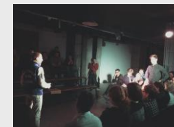
Zdjęcie 2. Teatr Peresełencia