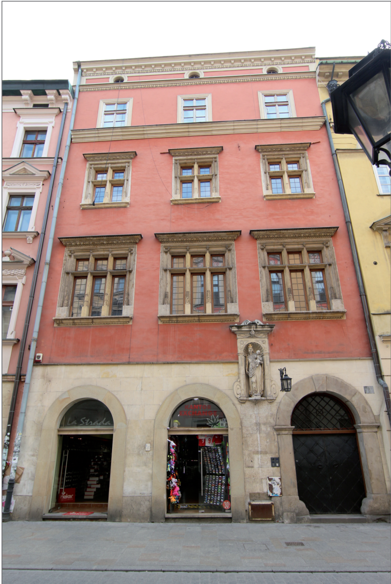
Kamienica Eichbergerowska w Krakowie przy ulicy Floriańskiej 7.