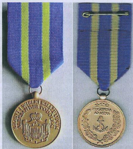
Fot. 2. Medal Regenta UPUM.