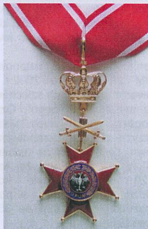
Fot. 1. Krzyż Monarchii UPUM.