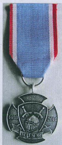
Fot. 3. Pamiątkowy Krzyż 600-lecia bitwy pod Grunwaldem.