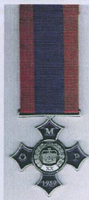
Fot. 4. Krzyż Jubileuszowy Organizacji Monarchistów Polskich.

a poniżej wstęga z napisem „UPUM”. Między ramionami krzyża miecze skierowane ostrzami w dół. Krzyż wykonany jest w trzech wersjach kolorystycznych (brązowej, srebrnej i złotej) odpowiednio dla poszczególnych stopni. Gwiazda orderowa o średnicy 60 mm w kształcie nierównego kręgu o obrzeżu stylizowanego na umieszczone naprzemiennie elementy muru obronnego i miecze rycerskie.