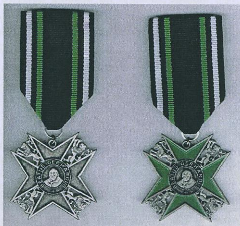
Fot. 7. Krzyż Humanitarny Błogosławionego Gerarda.