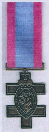
Fot. 5. Krzyż Świętego Kazimierza Królewicza.

Zgodnie z Uchwałą odznaczenie noszone jest na szyi na 40 mm wstążce w kolorze ciemnego kobaltu z dwoma czerwonymi paskami 11 .