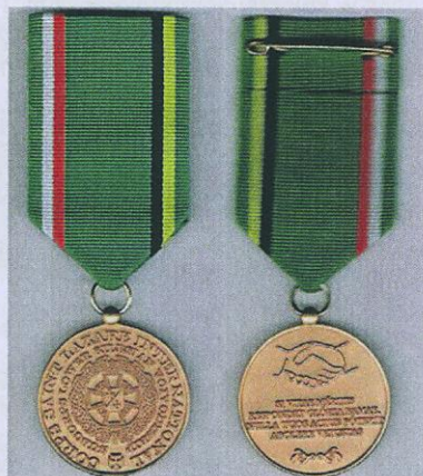
Fot. 8. Medal Subkorpusu Dolnośląskiego CSLI.

1.5. Krzyż Regencji UPUM – odznaczenie jednostopniowe ustanowione zostało uchwałą Rady Regencyjnej Unii Polskich Ugrupowań Monarchistycznych nr 2/04 z 15 sierpnia 2004 r. Jest ono nadawane jest przez Regenta „osobom pełniącym kierownicze funkcje w strukturach organizacyjnych Unii w dowód uznania wymiernej pracy na rzecz UPUM i Regencji oraz za zasługi w popularyzowaniu