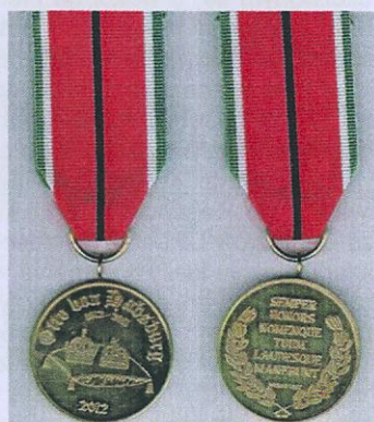
Fot. 6. Medal Pamięci Ottona von Habsburga.