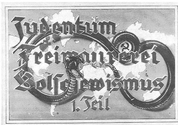
Slajd propagandowy „Żydostwo, Masoneria i Bolszewizm”, 1936

wstąpienie w 1932 r. do Sturmabteilung der NSDAP (SA), a następnie w 1935 r. do Schutzstaffel der NSDAP (SS) i kariera funkcjonariusza Sicherheitsdienst des Reichsführers-SS (SD). Ze strukturami tymi związał Six kolejną dekadę swojego życia. Równocześnie z tymi działaniami przez cały czas starał się dbać o rozwój kariery naukowej. Ukończywszy studia na Uniwersytecie w Heidelbergu, kontynuował naukę i w 1934 r. obronił dysertację doktorską zatytułowaną Die politische Propaganda des Nationalsozialismus . Opracowanie to ukazało się zresztą dwa lata później drukiem pod nieco zmienionym tytułem Die Politische Propaganda der NSDAP im Kampf um die Macht (1936). W tym samym czasie w 1936 r. ogłosił też rozprawę habilitacyjną Die Presse der nationalen Minderheiten im Deutschen Reich .