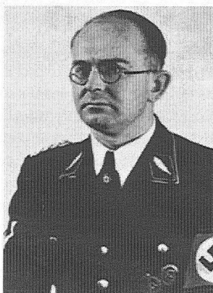
SS-Standartenführer Franz Alfred Six