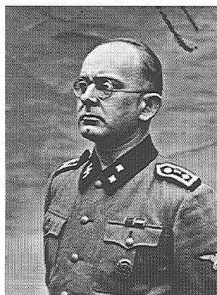
SS-Oberscharführer Franz Alfred Six

DOJŚCIE NAZISTÓW DO WŁADZY W SPOSÓB RADYKAŁNY ZMIENIŁO SYTUACJĘ NIEMIECKICH WOLNOMULARZY. HERMANN RAUSCHNING PRZYWOŁYWAŁ JEDNĄ Z WYPOWIEDZI HITLERA: „TERAZ MY JESTEŚMY NAJSILNIEJSI I DLATEGO USUNIEMY [...] ZARÓWNO KOŚCIÓŁ, JAK I MASONERIĘ”.