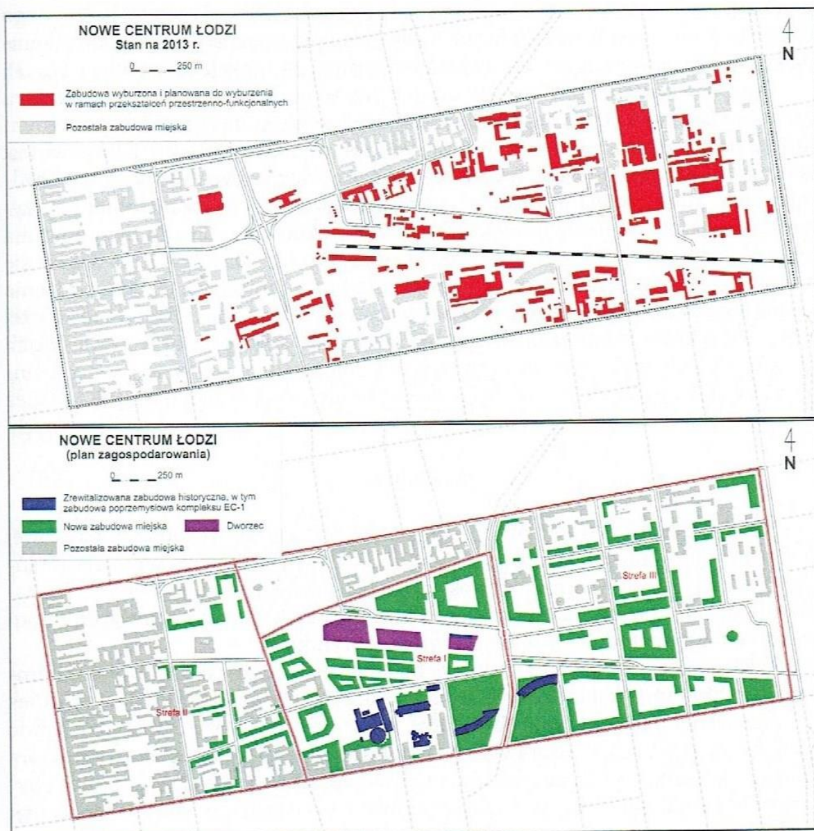
Ryc. 3. Przekształcenia przestrzenne w kwartałach śródmiejskiej objętych projektem „Nowe Centrum Łodzi”.