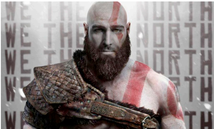
2 pav. Krepšinininko J. Valančiūno bendruomenės puslapis