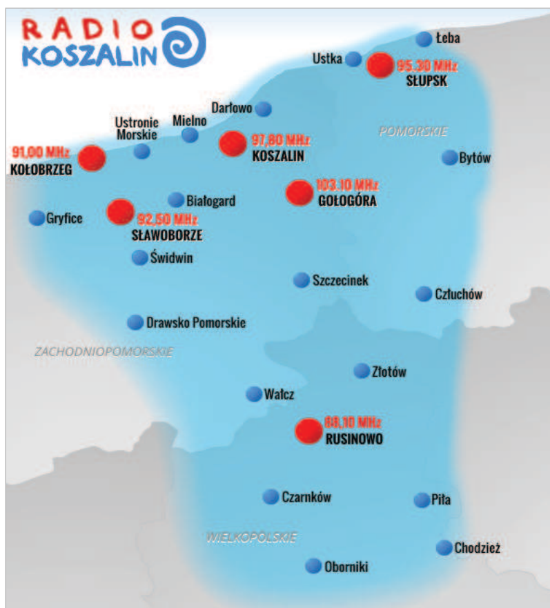
Mapa nr 1. Zasięg nadawania Polskiego Radia Koszalin

kańców powiatu słupskiego 7 . Ponadto działają redakcje w Słupsku, Pile oraz korespondenci w Szczecinku i Kołobrzegu. Program produkowany jest w technologii cyfrowej, nadawany analogowo z ośrodków nadawczych w Koszalinie, Słupsku, Kołobrzegu, Sławoborzu, Gołogórze i Rusinowie. Polskie Radio Koszalin posiada stacje nadawcze UKF – po dwa nadajniki dużej, średniej i małej mocy, sieć dosyłowa została zbudowana w 2002 r.