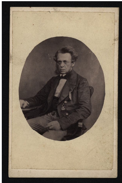
Fot. 1. Andrzej Artur hrabia Zamoyski herbu Jelita (1800–1874). Syn Stanisława Kostki Franciszka Zamoyskiego i Zofii księżnej Czartoryskiej herbu Pogoń Litewska