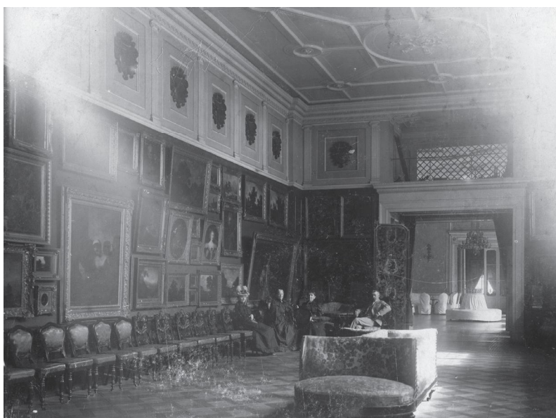
Fot. 1. Galeria warszawska Kossakowskich w pałacu przy Nowym Świecie 19.

Galerię warszawską Kossakowskich podziwiał m.in. car Aleksander II podczas pobytu w Warszawie, o czym również poinformował Kurier Warszawski 23 .