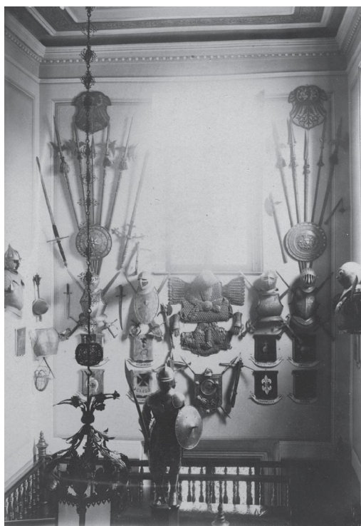
Fot. 2. Fragment kolekcji zbroi umieszczonej w pałacu w Wojtkuszkach. ·

częściowe informacje, jakie książki znajdowały się w wojtkuskim pałacu 24 . Poza biblioteką, w tym pałacu znajdowały się zbiory archeologiczne, paleontologiczne, numizmatyczne oraz zbrojownia. Poza tym, w komnatach pałacu umieszczono mundur cesarza Napoleona I ofiarowany Józefowi Antoniemu Kossakowskiemu 25 .