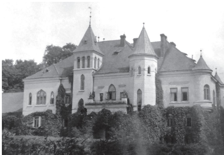
Fot. 4. Pałac w Wielkiej Brzostowicy. Źródło: ARKW – Wielka Brzostowica, Widok całego pałacu w Brzostowscy Wielkiej od dziedzińca.

Ostatni ordynat – Józef Kossakowski dzięki umiejętnemu gospodarowaniu odbudował majątek. Jego starania na przełomie 1923/1924 r. doprowadziły do zniesienia ordynacji lachowickiej 44 .