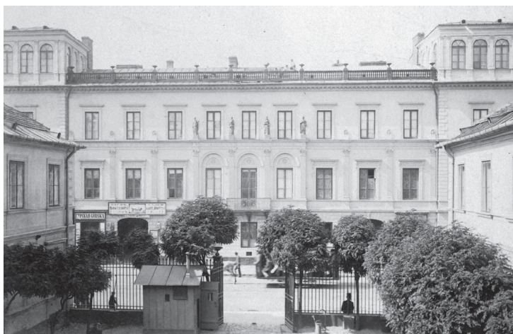
Fot. 6. Pałac Kossakowskich w Warszawie.