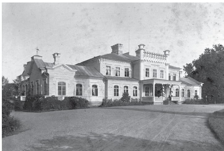
Fot. 5. Pałac w Nidokach.

Wojnickiego. W swoim pałacu Michał Stanisław postanowił odtworzyć rodzinne Wojtkuszki. Zgromadził tam część rodzinnej biblioteki oraz archiwaliów 47 .