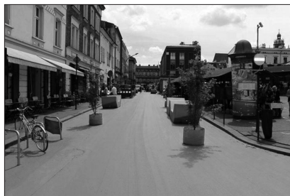
Fot. 1. Ulica Estery po wschodniej stronie Placu Nowego w trakcie prototypu

W pracy wykorzystano wyniki badań i wnioski z dwóch projektów, w których autor brał udział. Pierwszym był projekt „Alternatywna przestrzeń publiczna (APP) – Kazimierz 2017”, realizowany przez fundację Napraw Sobie Miasto, na zlecenie Urzędu Miasta Krakowa. Narzędziem badawczym użytym w tym projekcie było prototypowanie urbanistyczne, narzędzie tzw. urbanistyki zwinnej, szerzej zdefiniowanej w artykule P. Jaworskiego i A. Karłowskiej (2017). W ramach tej inicjatywy na dwóch pierzejach Placu Nowego ograniczono ruch samochodowy i stworzono z nich strefę pieszo-rowerową. Obszar tych badań wyróżniono za pomocą zielonej farby, a jezdnie wypełniono infrastrukturą tymczasową (meble miejskie i drzewa w doniczkach) – fot. 1.