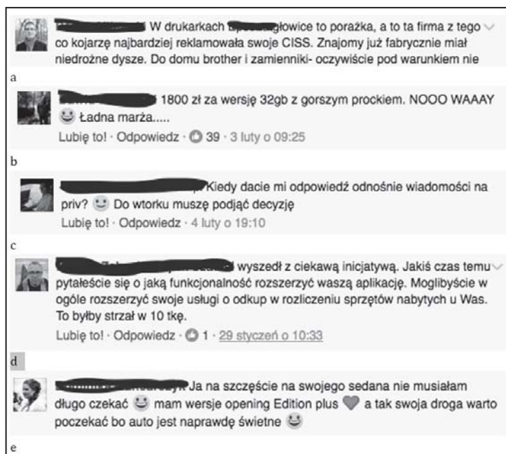
Rysunek 3. Przykłady opinii zamieszczanych na portalu Facebook

średnio dotyczące produktów. Przykłady opinii o produktach (zarówno pozytywnych, jak i negatywnych), których autorami są konsumenci znajdują się na rysunku 3.