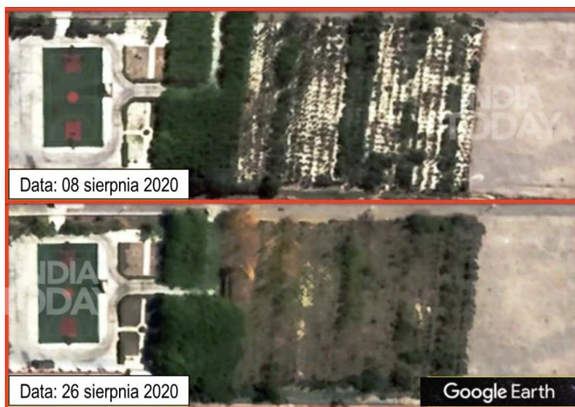
Rysunek 1. Przykłady zastosowania różnych wzorów maskowania obiektów wojskowych