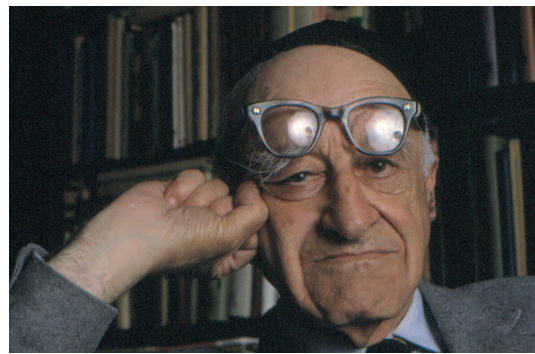
Zdjęcie 3. Nikt nie jest prorokiem we własnym kraju... 23

Według Y. Leibowitza Izrael od początku swego istnienia był takim samym państwem,