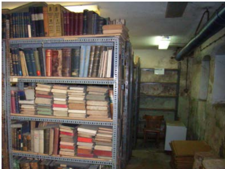
Magazyny zbiorów.

W drugiej dekadzie XXI wieku biblioteki – poprzez zmiany w sposobie funkcjonowania - mają możliwość współuczestniczenia w procesach związanych z budowaniem gospodarki opartej na wiedzy. Wykorzystanie środków finansowych dostępnych w ramach funduszy Unii Europejskiej pozwala dostosować biblioteki do potrzeb społecznych, czyniąc z nich konkurencyjne ośrodki informacji. Przykładem, który pomoże w zobrazowaniu zjawiska, jest powstające we Wrocławiu Dolnośląskie Centrum Informacji Naukowej i Ekonomicznej.