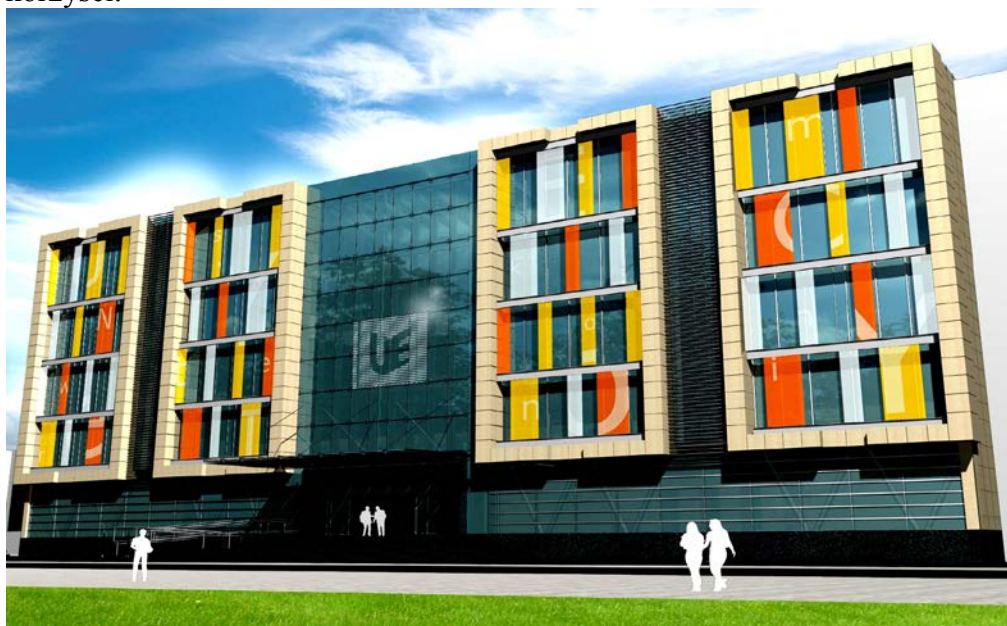
Fot. Pracownia „ARCHIMEDIA Architekci & Inżynierowie”: Wizualizacja głównego budynku Centrum 38

Rozbudowa infrastruktury bibliotecznej sprzyja zarówno tradycyjnej formie funkcjonowania biblioteki – w której nowym budynku będzie można korzystając z wolnego dostępu do książek realizować wzorem Eco plany poszukiwania konkretnych tytułów samemu w ogromie otwartych magazynów. Tradycja, połączona z nowoczesnością formy sprzyjać będzie zarówno realizacji ustawowych funkcji biblioteki, jak i spełnieniu oczekiwań społecznych wobec współczesnej biblioteki – czytelnicy. W prawnym aspekcie taka formuła pozwoli na stworzenie użytkownikom możliwości pełnego korzystania z przywileju bibliotecznego zapewnionego zapisem art. 28 PrAut. Centrum Informacji Ekonomicznej będzie natomiast zgodne z formułą nowoczesnego finansowania nauki – w krótkim czasie dostarczać informacji możliwie najwyższej jakości dla zainteresowanych przełożeniem bogactwa niemajątkowego na wymierne w pieniądzu korzyści.