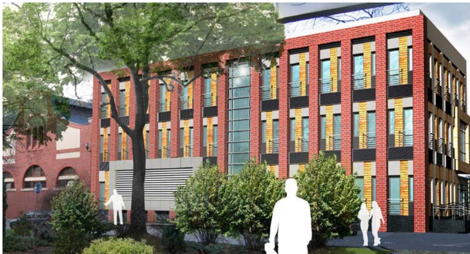
Fot. Pracownia „ARCHIMEDIA Architekci & Inżynierowie: Wizualizacja głównego budynku Centrum 42

Biorąc pod uwagę ideę połączenia tradycji z nowoczesnością, jaka towarzyszy od początku pomysłodawcom Dolnośląskiego Centrum Informacji Naukowej i Ekonomicznej, koncepcja biblioteki i nowoczesnego centrum infobrokingu zdaje się być skazana na sukces. 43 Argumentami przemawiającymi za takim postrzeganiem projektu są m.in.: