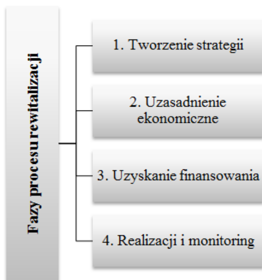
Rys. 2. Fazy procesu rewitalizacji.