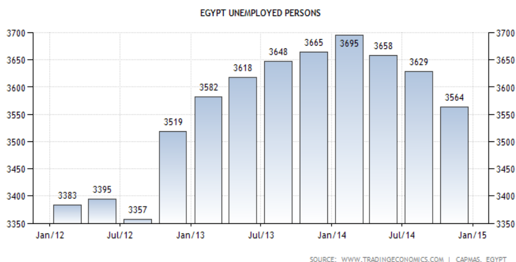
Rys. 1. Bezrobocie w Egipcie w latach 2012-2015 (mln)

w 2010 roku na 82,6 w połowie roku 2014 460 . Jest ono dość specyficzne, ponieważ posiada korzystną strukturę wieku, której prawie 70% zawiera się w kohorcie wieku 15-64, natomiast prawie 33% to część społeczeństwa w kohorcie do lat 14. Ludzie w wieku poprodukcyjnym, czyli powyżej 65. roku życia, stanowią tylko 4,5% ogółu populacji Egiptu. Średnia wieku wynosi niespełna 25 lat, a w wieku produkcyjnym znajduje się ponad 30% społeczeństwa 461 . Istotnym wskaźnikiem kapitału społecznego jest poziom wykształcenia, który mimo wysokiego poziomu analfabetyzmu wciąż rośnie. Niestety nie przekłada się to na spadek bezrobocia w Egipcie, które dotyka głównie ludzi w przedziale wiekowym od 15 do 24 lat i od 2010 roku sukcesywnie wzrasta. Dane przedstawione na rysunku 1 wskazują tendencję bezrobocia w latach 2012-2015.