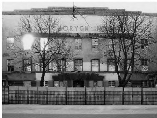
FOT. 3. Elewacja wejściowa od strony ul. Łągiewnickiej

cyjny, podpiwniczony, o zwartej bryle z użytkowym poddaszem, powstał na działce o powierzchni 1,5 ha, między ulicami Łągiewnicką, Ceglana a Rynkiem Bałuckim. Od zachodu działki zorganizowano ogród dla pacjentów. Plan budynku opracowano na wzór litery H, z wydatnymi ryzalitami w narożnikach zewnętrznym i dwoma dziedzińcami wewnętrznym i zewnętrznym (od strony ulicy). W osi budynku frontowego umieszczono wejście główne, z reprezentacyjną klatką schodową i przejściem na wewnętrzny dziedziniec. Sale dla pacjentów ulokowano wzdłuż traktów zewnętrznych. Elewacja wejściowa od strony wschodniej (ul. Łągiewnicka nr 34/36) uzyskała uskokowo ukształtowaną ściankę attykową, a pod nią dużych rozmiarów napis: KASA CHORYCH M. ŁODZI [FOT. 3]. Elewacja była symetryczna: w części wejściowej dziewięćoosiowa, w ryzalitach zaś pięćoosiowa ze zgrupowanymi w narożach oknami. Od podwórka została zaprojektowana identycznie jak od frontu, w ryzalitach