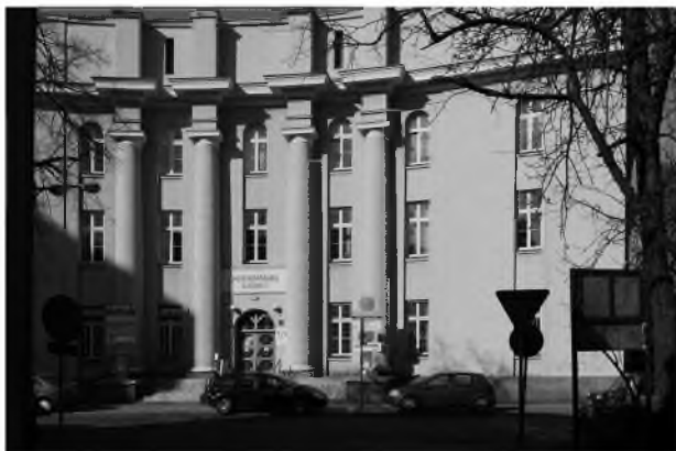
FOT. 4. Elewacja od strony ul. Lecznicy 6