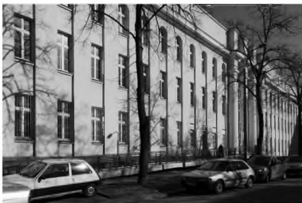
FOT. 5. Elewacja od strony ul. Kasowej

uzyskując układ trzyosiowy. Uszeregowanie prostokątnych okien podkreślały gzymsy parapetowe, nadokienne i filary między oknami. Parter budynku na całej jego wysokości boniowano pasowo. Wejście główne ozdobiło pięknym portalem, wydatnie wysuniętym przed lico muru, wraz z zaprojektowanym podjazdem [9]. Gmach ten wpisany został do wojewódzkiego rejestru zabytków pod nr. rej. A/107 w dn. 20 I 1971 r. z racji swej wyjątkowej architektury i funkcji medycznej. W czasie II wojny światowej umieszczono w nim siedzibę Głównego Szpitala Łódzkiego Getta. Po wywiezieniu z getta dzieci i osób starszych (tzw. „szperze”), w 1942 r. uruchomiono w dawnej przychodni zakłady krawieckie. Po 1945 r. ponownie przystosowano dawne sale dla szpitala o profilu położniczym, nadając placówce imię Heleny Wolf. Oddział ginekologiczny funkcjonował do końca lat 80. XX w., ale w wyniku rozpoczętych prac remontowych obiekt od kilkudziesięciu lat niszczeje. W starych murach planowano utworzyć klinikę medyczną, potem muzeum getta, hotel [10]. Od dłuższego czasu jest to ruina, zdezastwowana budowla o historycznym znaczeniu stojąca