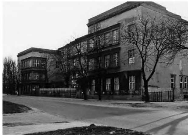
FOT. 2. Elewacja od strony ul. Łągiewnickiej i ul. Dolnej (fot. M. Bednarkiewicz)

Gmach przy ul. Łągiewnickiej nr 34/36 był wolnostojącym, murowanym z cegły budynkiem o powierzchni 9700 m 2 i kubaturze 39 400 m 3 . Budynek trzykondygn-