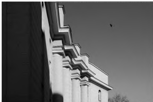
FOT. 6. Detal zwieńczenia elewacji od strony ul. Kasowej