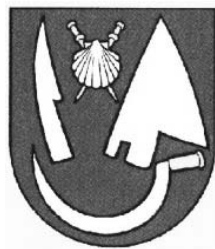
Volkovce Zlaté Moravce