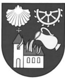
Záhorská Nová Ves Malacky

Ryc. 1. Ikonografia św. Jakuba w herbach gmin na Słowacji.