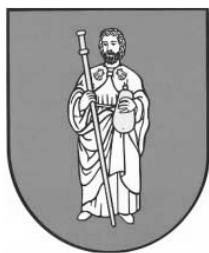
Bobrov (okres Námestovo)