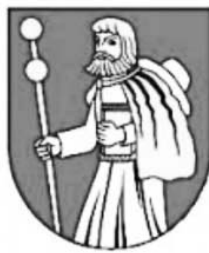
Hronské Kosihy (okres Levice)