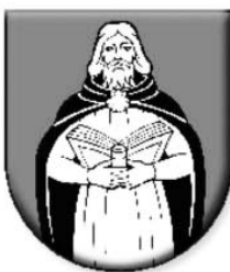
Jakubovany (okres Liptovský Mikuláš)