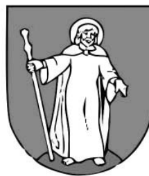
Jakubov (okres Malacky)