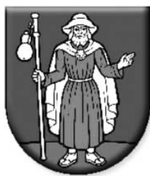
Dolné Vestenice (okres Prievidza)