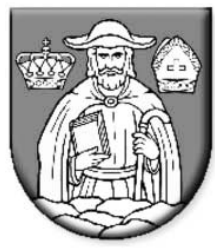
Lechnica (okres Kežmarok)