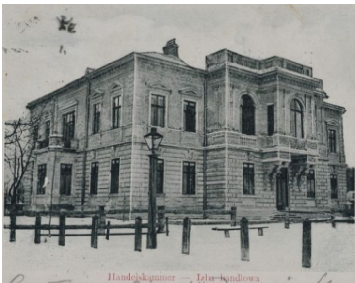
Izba Handlowa i Przemysłowa w Brodach (1905 rok).