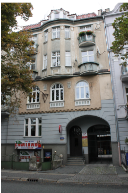
Dawna siedziba opolskiej ekspozytury Izby Przemysłowo-Handlowej w Katowicach. Stan obecny. Autor: Piotr Janus

Źródło: Wikimedia Commons, autor Cancre, http://commons.wikimedia.org/wiki/File:Pod_Globusem.JPG