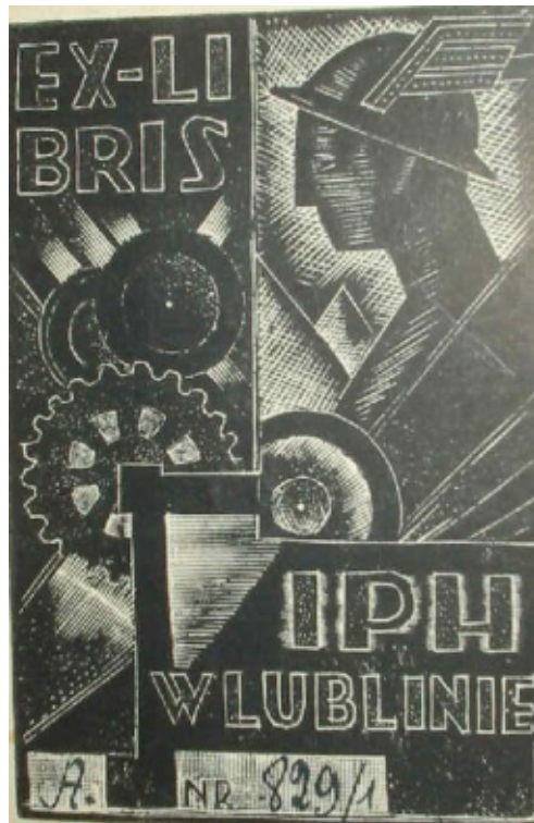
Eklibris Izby Przemysłowo-Handlowej w Lublinie.