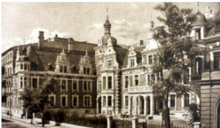
Budynek Izby Przemysłowo-Handlowej we Wrocławiu. Stan na lata 1949 - 1950.