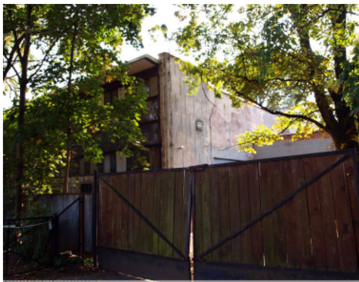
Pawilon Wytwórczości Prywatnej. Stan na 2010 rok