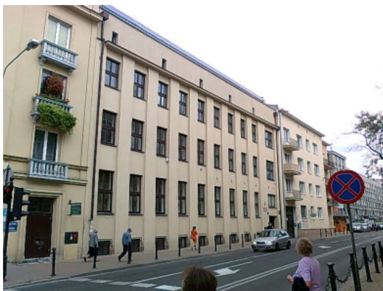
Dawna siedziba Izby Przemysłowo-Handlowej w Lublinie przy ul. Okopowej. Stan obecny. Autor: Karol Dąbrowski