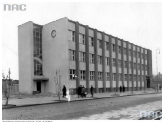
Gmach Izby Przemysłowo-Handlowej w Sosnowcu (II połowa lat trzydziestych).