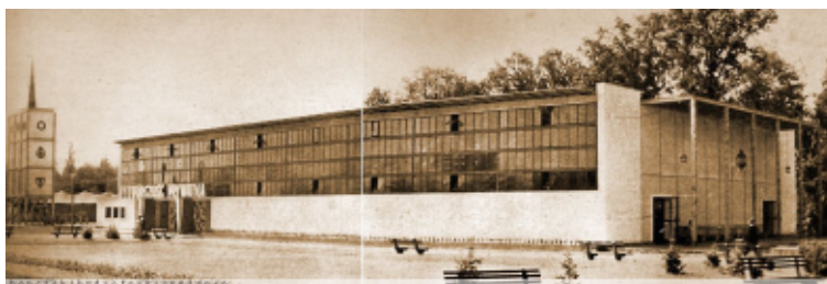
Pawilon Wytwórczości Prywatnej (Wystawa Ziem Odzyskanych, Wrocław 1948 rok) z ekspozycjami zrzeszeń prywatnego przemysłu, Związku Izb Rzemieślniczych i Wydział Koordynacji Izby Przemysłowo-Handlowej w Warszawie