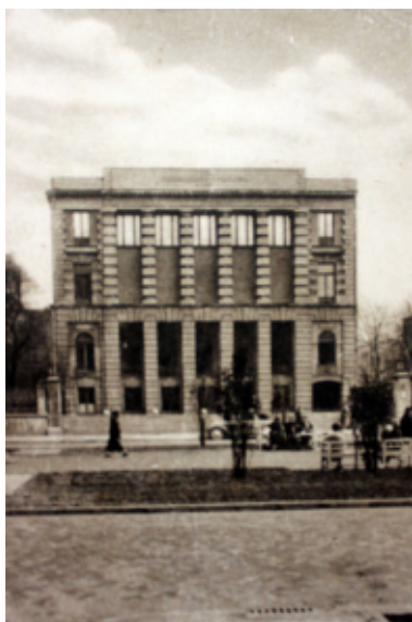
Budynek Izby Przemysłowo-Handlowej w Łodzi (ob. Rektorat Uniwersytetu Medycznego). Stan na lata 1949 - 1950.