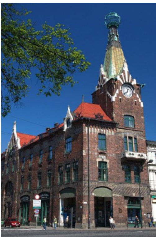
"Dom pod Globusem" - budynek Izby Przemysłowo- Handlowej w Krakowie (stan na 2009 rok).