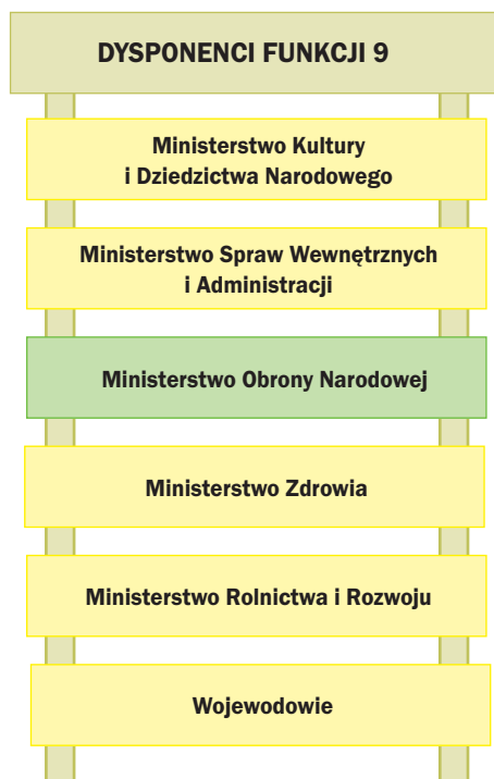
Rys. 5. Dysponenci funkcji 9 – Kultura i ochrona dziedzictwa narodowego

Funkcja 9. Kultura i ochrona dziedzictwa narodowego (rys. 5). Obejmuje działania, które wpływają na kształtowanie pozytywnego wizerunku kraju w Europie i na świecie. Kultura jest także podstawowym elementem rozwoju społeczno-gospodarczego. W sferze kultury i dziedzictwa narodowego niezwykle istotne jest wykonywanie zadań związanych z zachowaniem, ochroną i rewitalizacją materialnego dziedzictwa kulturowego przez renowację, konserwację oraz adaptację obiektów zabytkowych. W ramach tej funkcji są prowadzone działania, które wspomagają budowę i modernizację obiektów, związanych z upowszechnianiem dóbr kultury narodowej, w tym odpowiednią jej promocją. Rozwijane są także działania wspierające inicjatywy: edukacyjne, wycho-