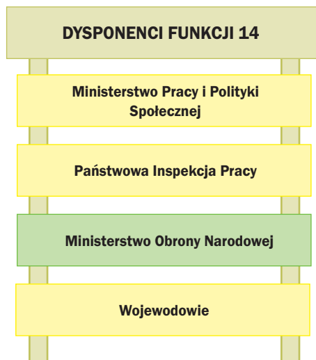
Rys. 9. Dysponenci funkcji 14 – Rynek pracy

Funkcja 14. Rynek pracy. Obejmuje działania państwa na rynku pracy (rys. 9), związane z zatrudnieniem i ograniczeniem bezrobocia oraz jak największą aktywizacją zawodową obywateli. Wspierane jest tworzenie nowoczesnych publicznych służb zatrudnienia oraz efektywnych instrumentów aktywnej polityki rynku pracy, zwłaszcza w odniesieniu do osób starszych i młodzieży. Równocześnie jest kontynuowana polityka osłonowa w postaci wypłat świadczeń dla osób bezrobotnych. Podejmowane są działania, które mają na celu budowę nowoczesnej gospodarki i zrównoważonych stosunków pracy, wspiera się rozwój kadry oraz zwalczanie nierówności na rynku pracy. Istotnym społecznie elementem dla tej dziedziny aktywności państwa jest tworzenie większych możliwości zatrudniania osób niepełnosprawnych.