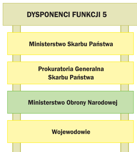
Rys. 3. Dysponenci funkcji 5 – Ochrona praw i interesów Skarbu Państwa

pośrednia i bezpośrednia), nadzoruje działalność spółek z udziałem Skarbu Państwa, gospodaruje przejętym mieniem po zlikwidowanych lub upadłych przedsiębiorstwach państwowych, zaspokajają także roszczenia majątkowe wobec Skarbu Państwa.