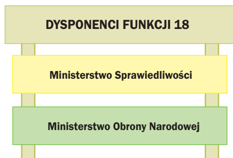
Rys. 11. Dysponenci funkcji 18 – Sprawowanie i wykonywanie wymiaru sprawiedliwości

sądu, mierzone: Liczbą spraw załatwionych do liczby spraw wpływających (wskaźnik opanowania wpływu spraw) , oraz jedno podzadanie: Zapewnienie warunków organizacyjnych i technicznych funkcjonowania sądów w celu: Poprawy warunków organizacyjno-technicznych funkcjonowania sądów przy zastosowaniu miernika opisowego osiągnięcia celu.