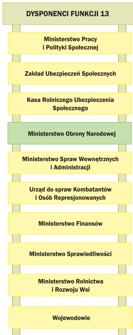
Rys. 8. Dysponenci funkcji 13 – Zabezpieczenie społeczne i wspieranie rodziny

należności związanych ze zwolnieniem żołnierzy z zawodowej służby wojskowej. Wygenerowano w niej jedno zadanie: