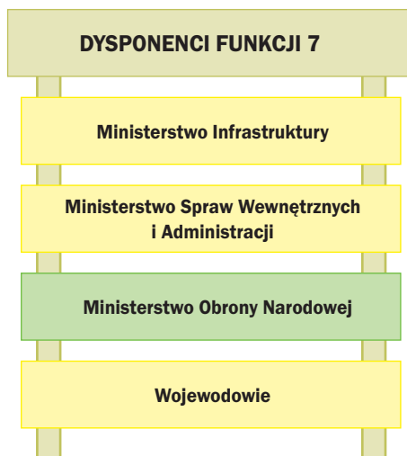
Rys. 4. Dysponenci funkcji 7 – Gospodarka przestrzenna, wspieranie rozwoju budownictwa i mieszkalnictwa

Resort obrony narodowej wykonuje także trzy podzadania. Pierwsze dotyczy: Przekształceń własnościowych (prywatyzacji) w celu: Zmniejszenia stanu posiadania Skarbu Państwa , mierzone: Rentownością