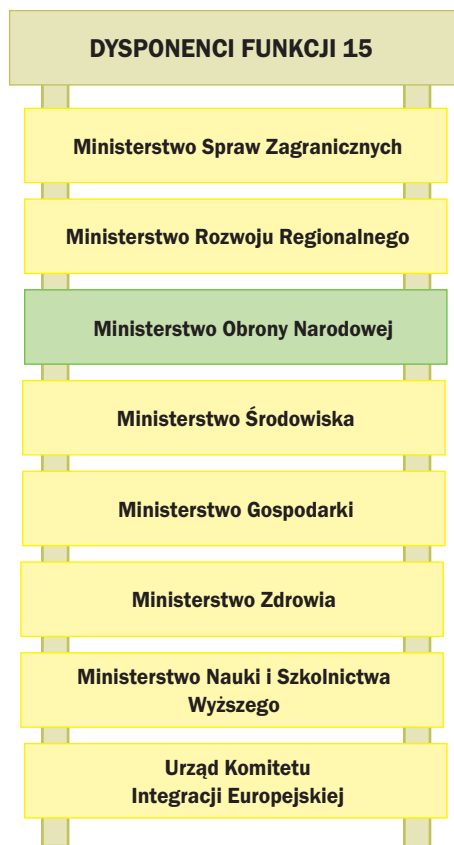
Rys. 10. Dysponenci funkcji 15 – Polityka zagraniczna

Funkcja 18. Sprawowanie i wykonywanie wymiaru sprawiedliwości (rys. 11). Wynika z konstytucyjnego obowiązku państwa, jakim jest zapewnienie obywatelom prawa do sądu, sprawiedliwego oraz jawnego rozpatrzenia spraw bez nieuzasadnionej zwłoki przez właściwe, niezależne, bezstronne i niezawisłe sądy. W ramach realizacji tego prawa są prowadzone działania, które mają na celu zapewnienie prawidłowego funk-