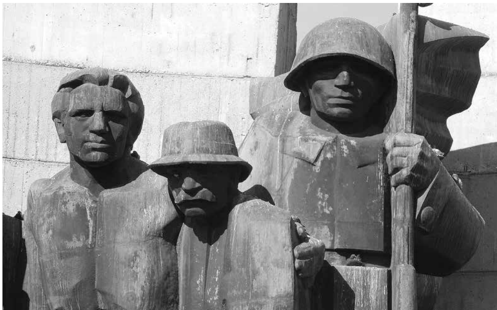
Rysunek 1. Fragment Pomnika Czynu Rewolucyjnego

są specyficznym, nieredukowalnym do innych dziedzin produkcji układem społeczno-kulturowym. Natomiast zgodnie ze stalinowską wizją uspołecznienia rolnictwa, kolektywizacja rolnictwa miała ostatecznie rozwiązać kwestię agrarną i chłopską w krajach demokracji ludowej poprzez sprowadzenie chłopów do robotników rolnych. Zetatyżowanie rolnictwa w Polsce nie powiodło się komunistom. Dlatego też Pomnik Czynu Rewolucyjnego można między innymi uznać za symbol klęski stalinowskiej rewolucji w Polsce.