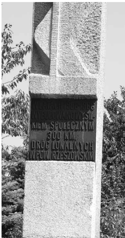
Rysunek 4. Fragment obelisku upamiętniającego zbudowanie 300 km dróg w powiecie rzeszowskim w czynie społecznym

Pomnikiem mało eksponowanym w narracji o „miejscach mistycznych” Rzeszowa jest pomnik przy ulicy Podleśnej w Budziwoju (Rys.4).